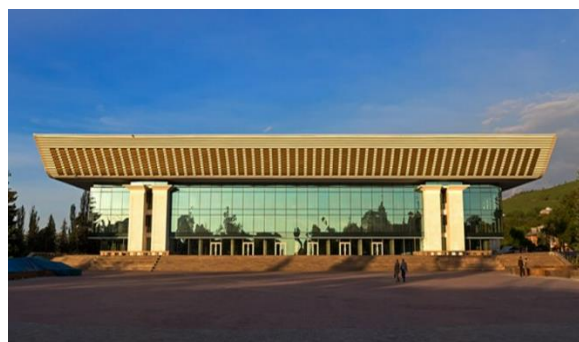
Здание после реконструкции

Рисунок 1. Дворец Республики, впоследствии Дворец им. В.И. Ленина, 1970 год.