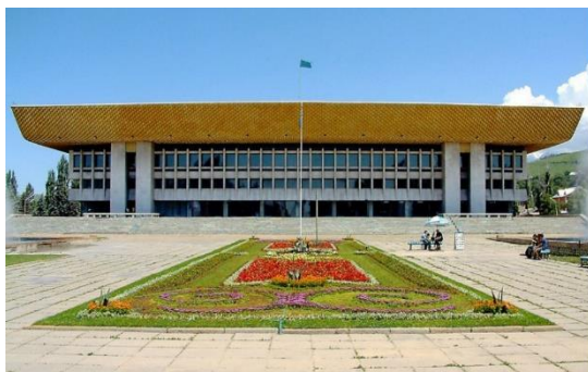
Здание до реконструкции

в Алматы. На рис. 1 представлены фотографии фасадов здания до и после реконструкции, где визуально видно искажение исходной архитектоники и пластики здания. Аутентичность памятника архитектуры также потеряна вследствие применения современных материалов. При этом критерии аутентичности являются важнейшими при сохранении архитектурного и культурного наследия в мировой практике, а также «решающим фактором при включении исторических объектов/мест в список всемирного наследия ЮНЕСКО» (Voskova, K.T. & Urland, A., 2023).