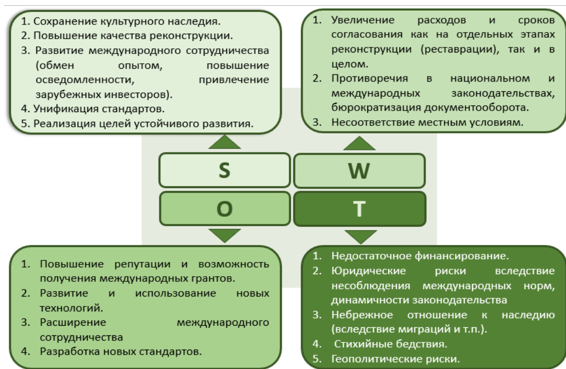
Рисунок 3. Влияние международных норм и стандартов на реконструкцию исторических зданий: SWOT-анализ

В рамках исследования проведён SWOT-анализ, оценивающий влияние международных норм и стандартов на реконструкцию исторических зданий. Этот метод позволил выделить не только сильные и слабые стороны, но и определить перспективы и потенциальные риски, связанные с их применением в ходе реконструкции (рис. 3).